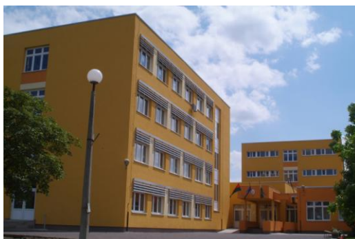
Vadas u. 2. szám alatti főépületünk

Törvényi rendelkezés alapján 2016. július 1-jétől a kollégium leválasztásra került intézményunktől és áthelyezték a Ceglédi Dózsa György Kollégium fennhatósága alá.